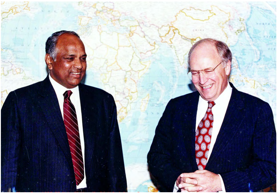
❖ अमेरिकेचे संरक्षण सचिव डिक चेनी यांच्यासमवेत वॉशिंग्टन डी. सी. येथे श्री. शरद पवार