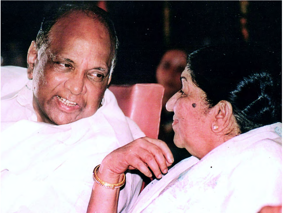
❖ गानसम्राज्ञी भारतरत्न लता मंगेशकर यांच्यासमवेत श्री. शरद पवार