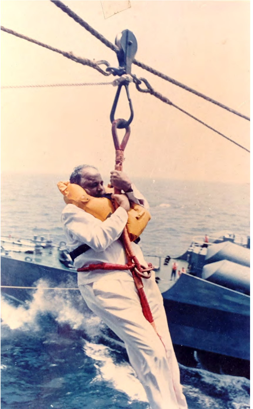
❖ "बॉम्बे" हाय मध्ये झालेल्या नौदलाच्या सरावात सहभाग घेताना श्री. शरद पवार