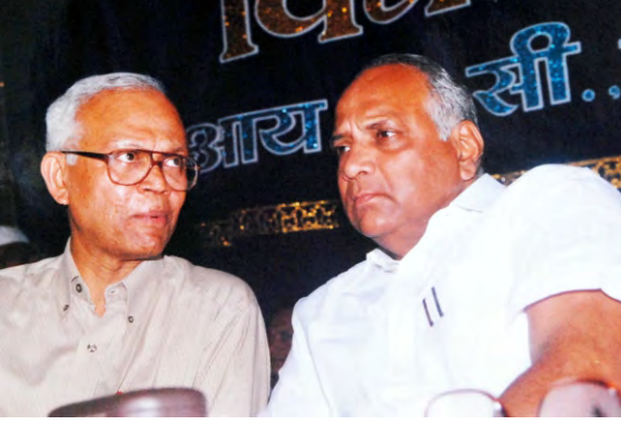
❖ ज्येष्ठ शास्त्रज्ञ रघुनाथ माशेलकर यांच्यासवमेत श्री. शरद पवार