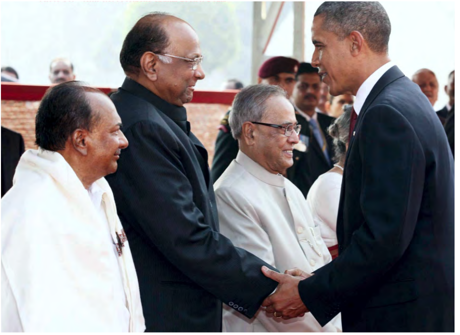
❖ अमेरिकेचे राष्ट्राध्यक्ष बराक ओबामा यांच्यासमवेत श्री. शरद पवार