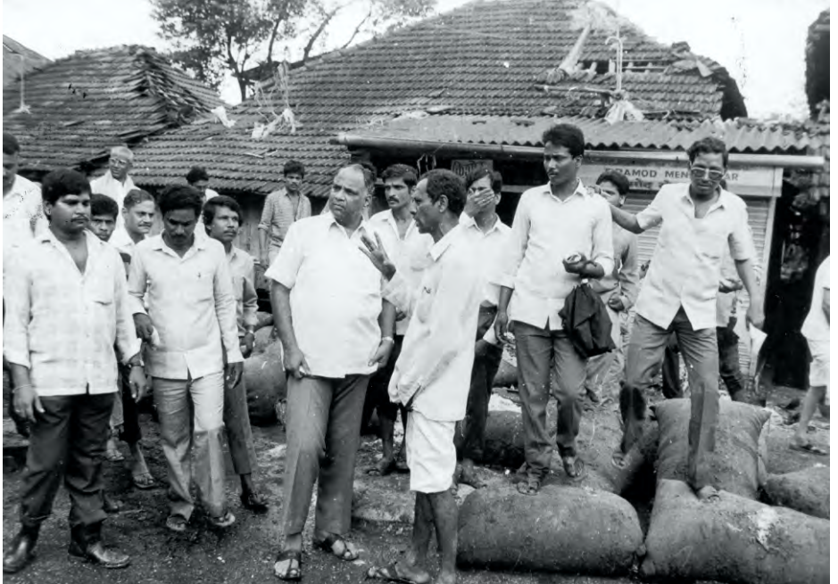
❖ रायगड जिल्ह्यातल्या नागोठणे येथे महापुरामुळे नुकसान झालेल्या स्थितीची पाहणी करताना श्री. शरद पवार