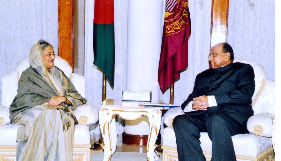
❖ बांगला देशच्या पंतप्रधान शेख हसिना वाजेद यांच्यासमवेत शेतीविषयक प्रश्नांची चर्चा करताना श्री. शरद पवार