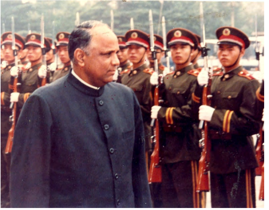
❖ चीनमध्ये सैनिकांकडून मानवंदना स्वीकारताना श्री. शरद पवार