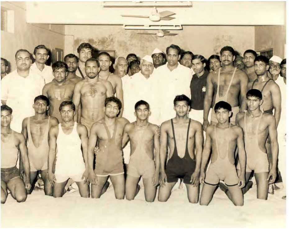
❖ युवा कुस्तीगीरांसमवेत श्री. शरद पवार