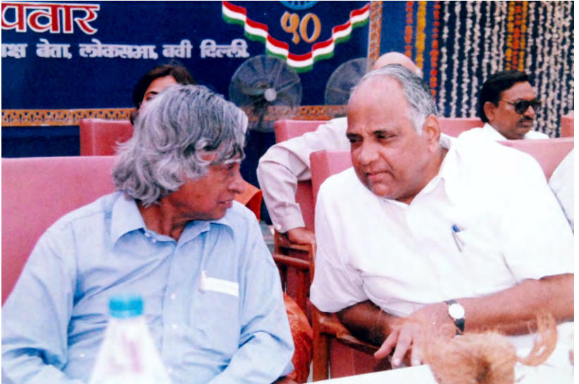
❖ भारताचे माजी राष्ट्रपती (दिवंगत) डॉ. ए.पी.जे. अब्दुल कलाम यांच्यासमवेत श्री. शरद पवार