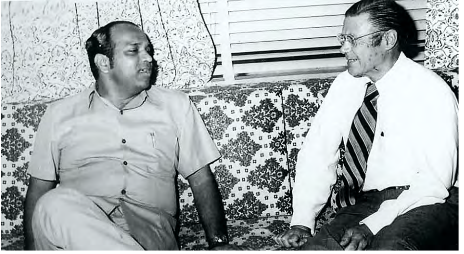
❖ जागतिक बँकेचे अध्यक्ष डॉ. रॉबर्ट मॅकमार यांच्यासमवेत श्री. शरद पवार