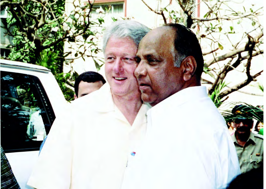
❖ अमेरिकेचे माजी अध्यक्ष बिल क्लिंटन यांची श्री. शरद पवार यांच्या निवासस्थानी भेट