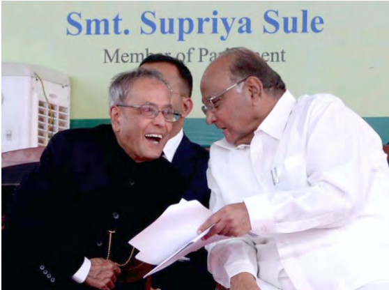
❖ भारताचे राष्ट्रपती प्रणव मुखर्जी आणि श्री. शरद पवार यांच्यात हास्यविनोद