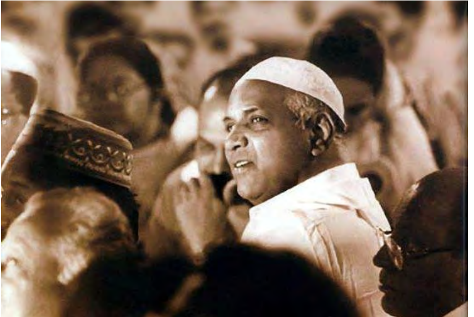
❖ एका इफ्तार पार्टीवेळी श्री. शरद पवार